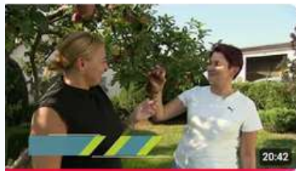
Innowacyjna przedsiębiorczość szansą na rozwój dla pomorskich rolników cz. 2