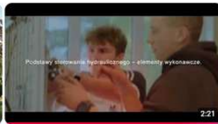
Agrotронika i informatyzacja w mechanizacji rolnictwa