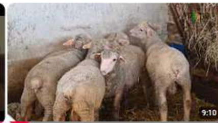
Rasy zachowawcze i ich potencjał w rozwoju obszarów wiejskich