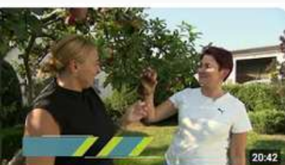
Innowacyjna przedsiębiorczość szansą na rozwój dla pomorskich rolników cz. 2