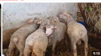
Rasy zachowawcze i ich potencjał w rozwoju obszarów wiejskich