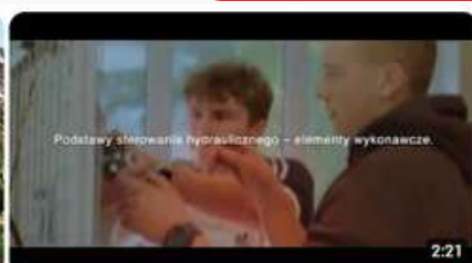
Agrotronika i informatyzacja w mechanizacji rolnictwa