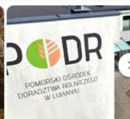
Innowacyjna przedsiębiorczość szansą dla pomorskich rolników